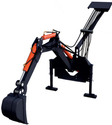
KEPÇE / KAZICI